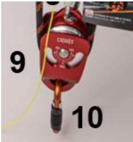
ISC Flaschenzugrolle (9)

Durch die Oneway-Rollenlagerung (Zusätzliche Bremswirkung durch Seilreibung) blockieren die Rollen beim Ablassen und zum Anheben drehen sie frei.