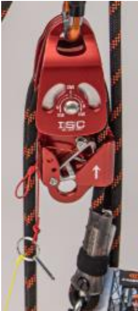
ISC Progress-Capture Flaschenzugrolle (5) Seilklemme entriegelt = Aufziehen.